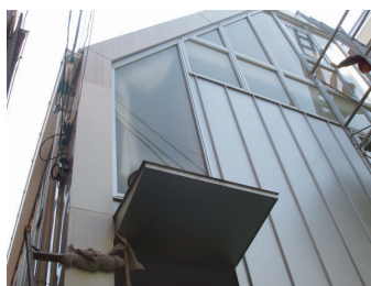
ガルバリウム鋼板