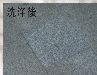
バナー御影石洗浄